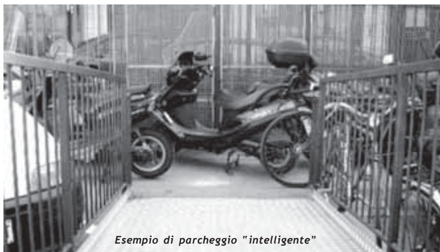
Esempio di parcheggio "intelligente"

Cittadinanzattiva, con questa campagna, ripropone ancora una volta la centralità dell'individuo nella partecipazione sociale, in un contesto solidale e democratico di "cittadinanza attiva". ■