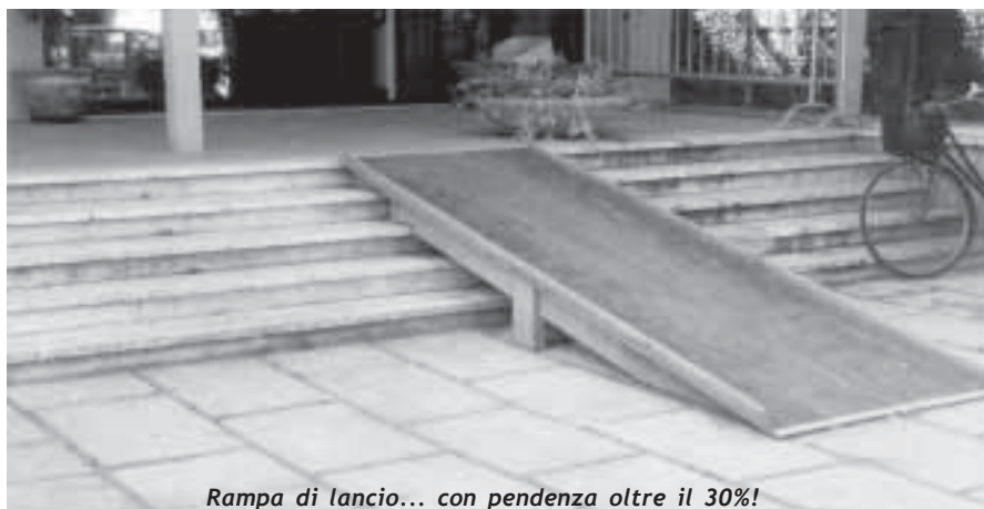
Rampa di lancio... con pendenza oltre il 30%!

Vittime di questa situazione, non sono solo le persone con disabilità fisiche o motorie, permanenti o temporanee, ma anche anziani, persone obese o semplicemente genitori con passeggini: se da una parte quindi, resta